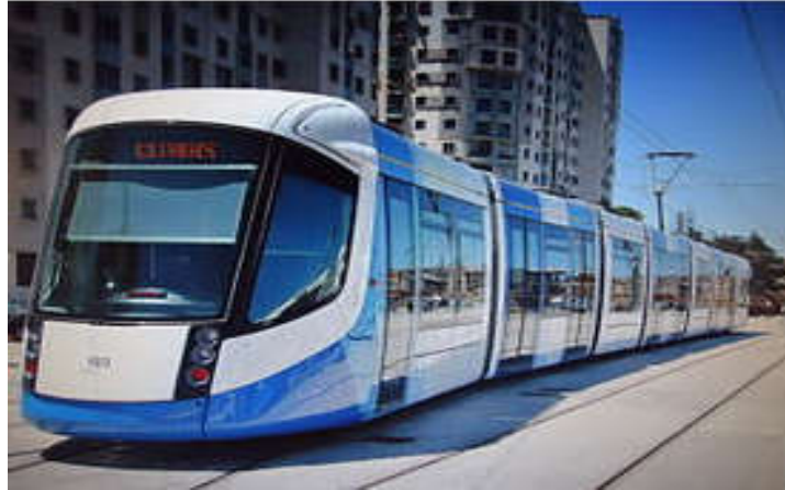
صورة رقم (02) لترامواي الجزائر