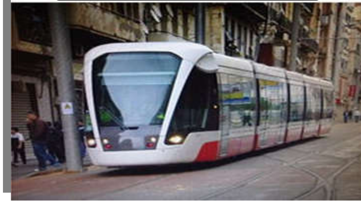
صورة رقم (01) لترامواي وهران