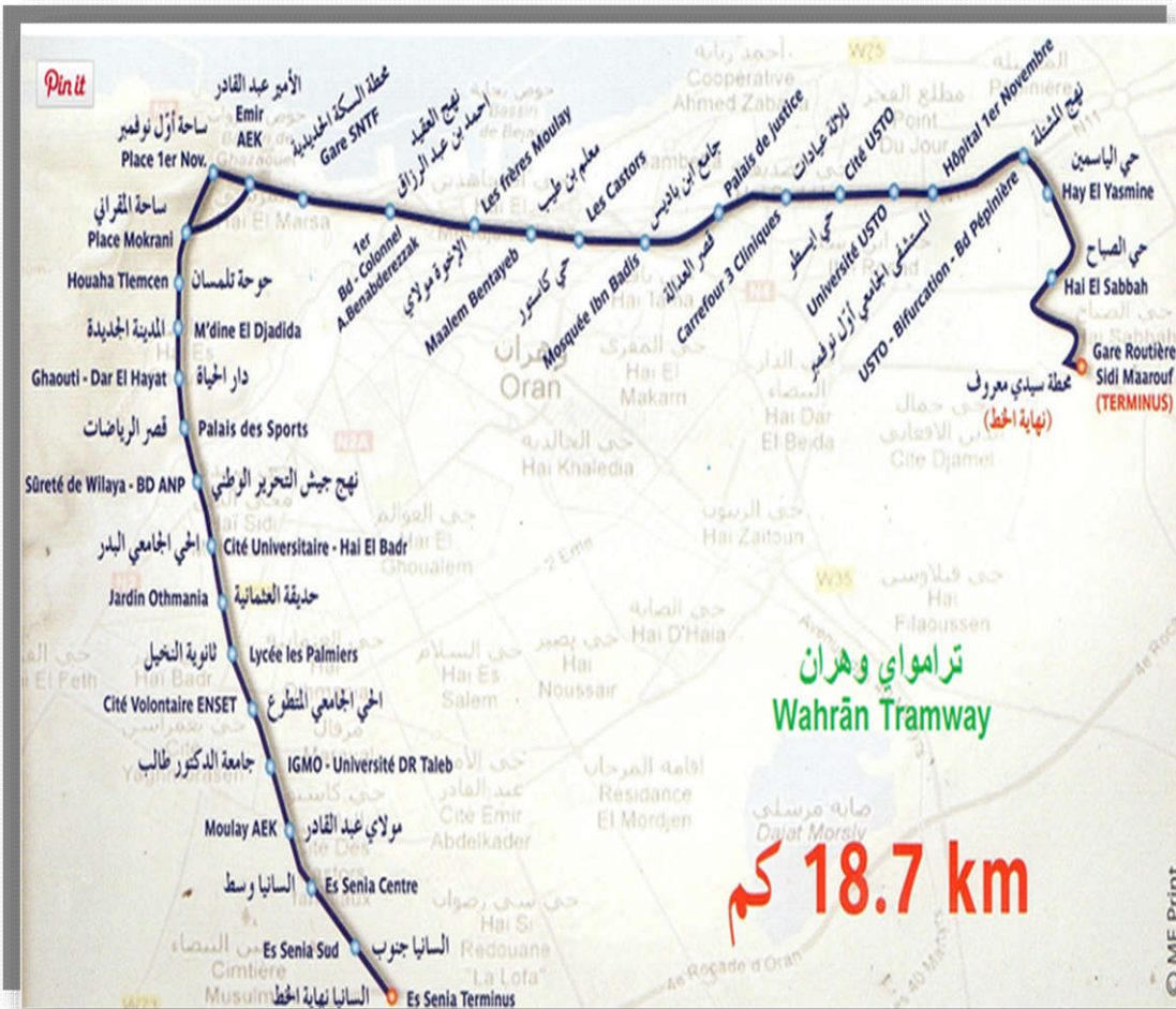
مخطط رقم (01) لمسار ترامواي وهران